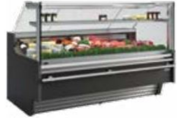
Imagen de producto / product image