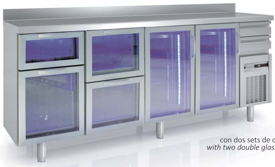
FMRV-250 con dos sets de cajones dobles with two double glass drawers sets