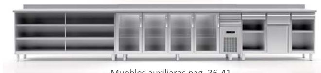
Muebles auxiliares pag. 36-41 Auxiliar furnitures pag. 36-41