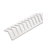
Easy, para la creación del vacío externo