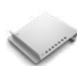
Estantes Planos Inclinados